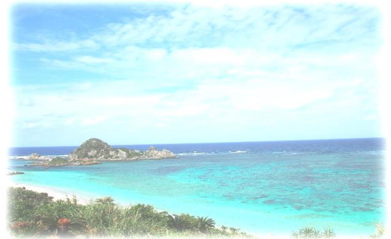
2015年 沖縄 石垣島 設立25周年記念旅行にて